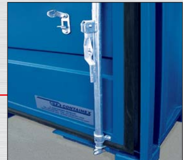
Porte avec joint en caoutchouc et barre de fermeture galvanisée