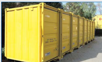
Mover-Box pour stockage