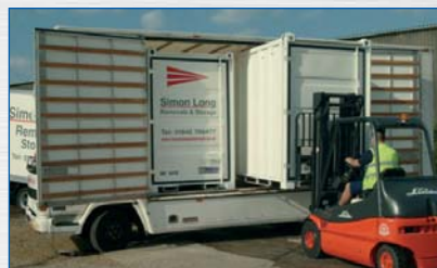
Chargement de Mover-Box