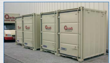
Mover-Box chez un déménageur