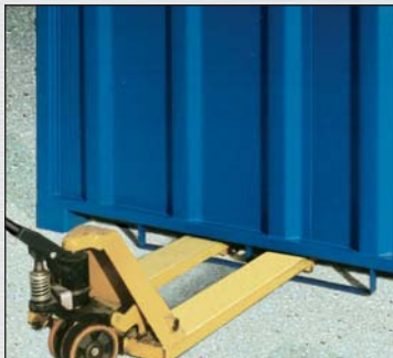
Passages de fourches compatibles pour transpalette